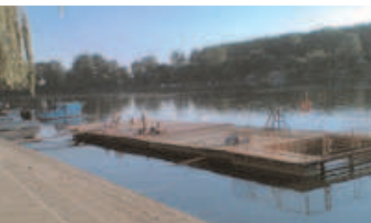
Theiss – Strandbad