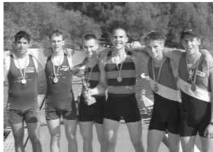
Junioren-A-Doppelzweier: 1. WRC Pirat B1, 2. RV Nautilus Klagenfurt, 3. VST Völkermarkt