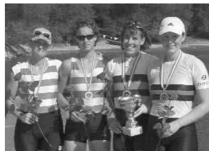
Frauen-Doppelzweier: 1. WRK Donau, 2. Erster WRC LIA B1