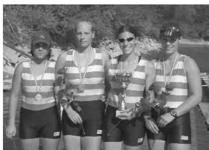
Juniorinnen-A-Doppelvierer: 1. Erster WRC LIA