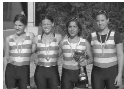
Juniorinnen-B-Doppelvierer ohne St.: 1. Erster WRC LIA