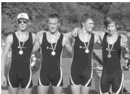
Junioren-A-Vierer o. St.: 1. WSV Ottensheim