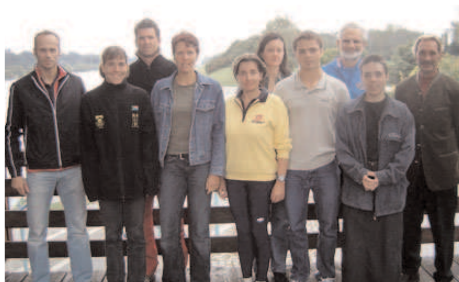
Die neuen Lehrwarte mit der Prüfungskommission:

Bleibt nur noch zu hoffen, dass wir unser neu erworbenes Wissen auch an die Ruderer weitergeben ...!