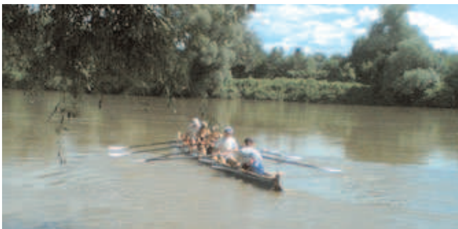
Ablegen in Mako (Ungarn)

Wir legen an einem Campingplatz mit dauerkalten Duschen, aber einem lustigen Spielplatz an. Beim Abendessen, das zum Schluss mit mehreren Hunden geteilt wurde, werden wir auf ein Getränk eingeladen und man führt sogar ein Konzert für uns auf.