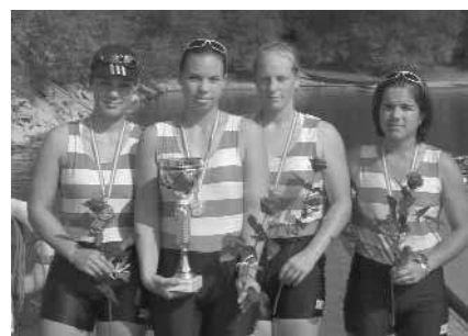
Juniorinnen-A-Vierer o. St.: 1. Erster WRC LIA