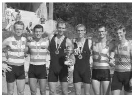
Leichtgewichts-Männer-Doppelzweier: 1. RV Wiking Bregenz, 2. Erster WRC LIA B1, 3. Erster WRC LIA B2