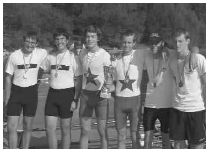
Schüler-Doppelzweier: 1. RV Wiking Linz, 2. RV Alemannia Korneuburg, 3. RV Seewalchen