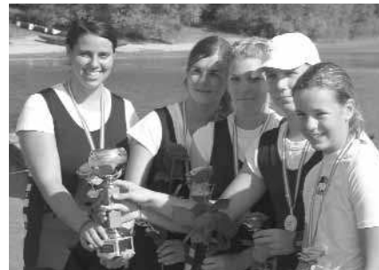
Schülerinnen-Doppelvierer m. St.: 1. RV Wiking Bregenz