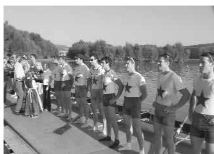
Männer-Achter mit St.: 1. Erster WRC LIA, 2. WSV Ottensheim, 3. RV Wiking Linz