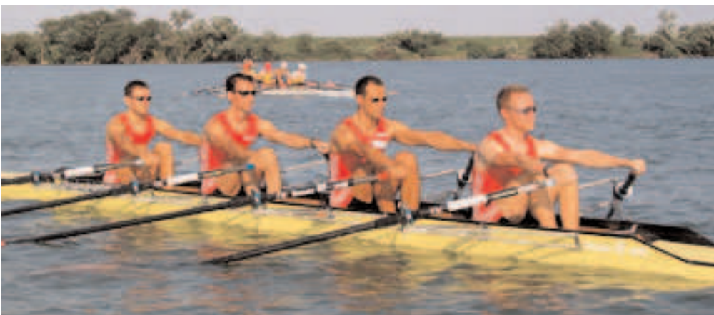
Unglücklicher vierter Platz für unseren Leichtgewichts-Doppelvierer

Am Montag machten wir uns jedenfalls zufrieden auf den Weg nach Osaka, um von dort Richtung Wien aufzubrechen.