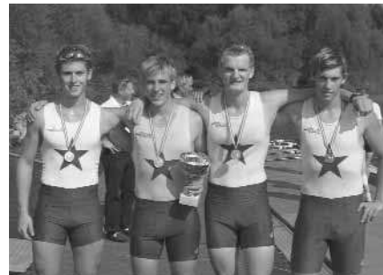
Junioren-A-Doppelvierer: 1. RV Wiking Linz