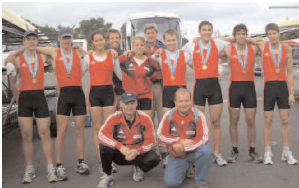
Die erfolgreiche österreichische Mannschaft mit ihren Betreuern

Die beiden Juniorenboote konnten ihre Vorläufe gewinnen. Die Mädchen hatten, so wie sie am Samstag mit der Auslosung Glück gehabt hatten, nun leider Pech. Der 4. Platz, obwohl gut gerudert, reichte