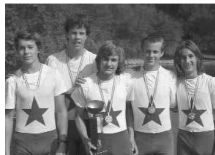
Schüler-Doppelvierer mit St.: 1. RV Wiking Linz