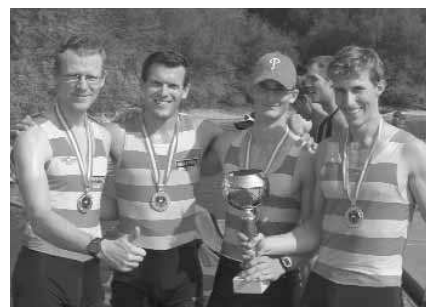
Leichtgewichts-Männer-Doppelvierer: 1. Erster WRC LIA