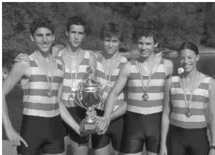
Junioren-B-Vierer mit St.: 1. Erster WRC LIA