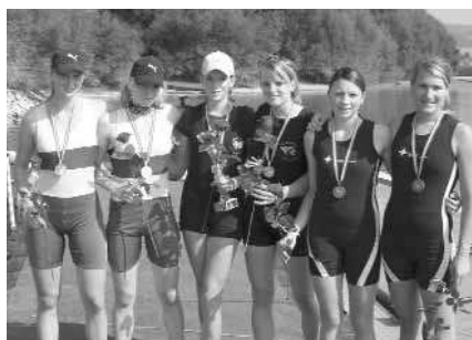
Juniorinnen-B-Doppelzweier: 1. RV Seewalchen, 2. RC Möve Salzburg, 3. WSV Ottensheim