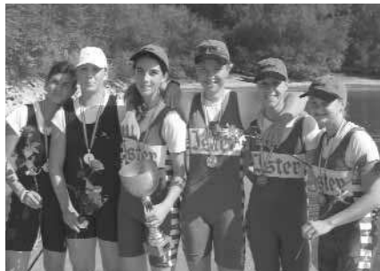
Schülerinnen-Doppelzweier: 1. LRV Ister B1, 2. RV Wiking Bregenz, 3. LRV Ister B2