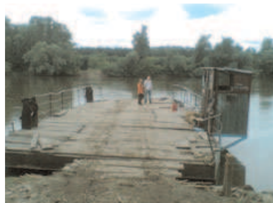
Eine Fähre an der verschlammten Maros (Rumänien)

Wir übernachteten im „Hotel Royal“ in einem Sieben- bzw. Einbettzimmer mit zu