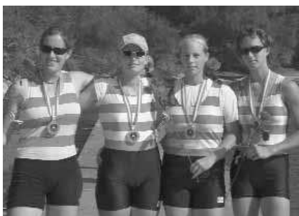
Frauen-Vierer-ohne: 1. Erster WRC LIA B1