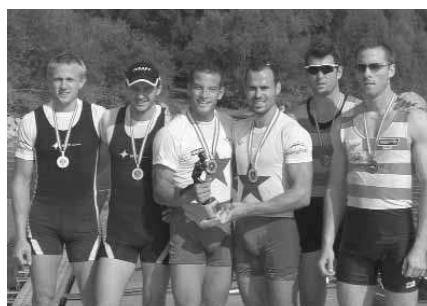
Männer-Doppelzweier: 1. RV Wiking Linz, 2. WSV Ottensheim, 3. Erster WRC LIA