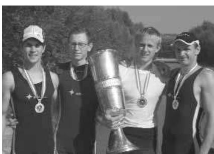
Männer-Vierer-ohne: 1. WSV Ottensheim