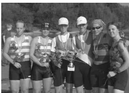
Juniorinnen-A-Doppelzweier: 1. VST Völkermarkt, 2. Erster WRC LIA, 3. WRC Pirat