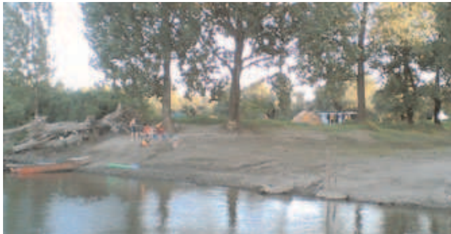
Theiss – Serbien

Nachdem wir keine Einreisestempel nach Serbien hatten, weil wir die Grenze per Boot überschritten hatten, mussten wir